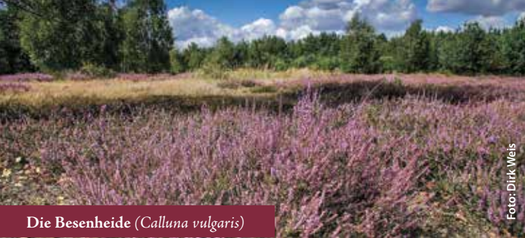
Die Besenheide ( Calluna vulgaris )