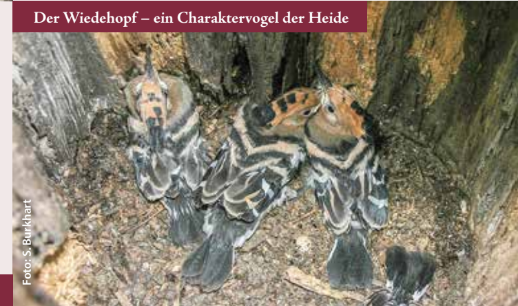
Der Wiedehopf – ein Charaktervogel der Heide

Auf Initiative der NABU-Ortsgruppe Wittichenau, begann vor vielen Jahren ein Projekt zum Schutz des Wiedehopfes unter fachlicher Begleitung der Vogelschutzwarte Neschwitz. Nisthilfen wurden errichtet und Jungvögel beringt. Nun leben wieder ca. 20 Brutpaare im Gebiet. 2017 flogen 57 Jungvögel aus. Mittlerweile unterstützt auch die Allianz-Versicherung mit Spenden das Projekt, welches nun gemeinsam mit der Naturschutzstation Neschwitz weiterentwickelt wird. Flächen sollen entbuscht, Heiden- und Trockenrasen gepflegt und weitere Nistkästen angebracht werden.