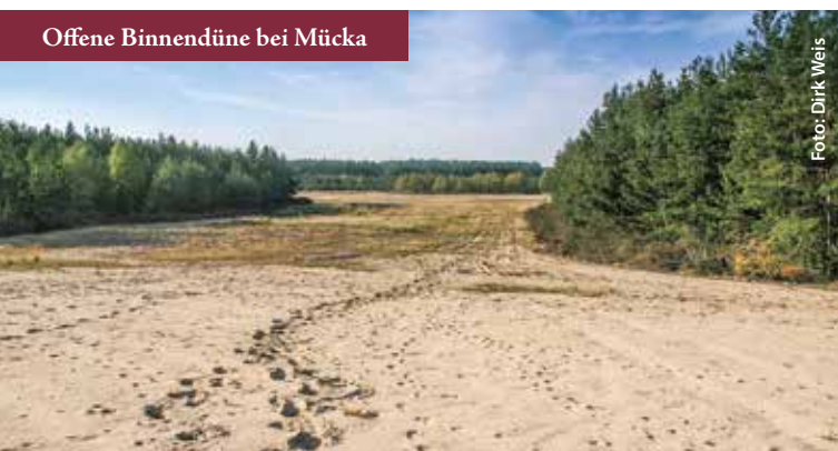
Offene Binnendüne bei Mücka

Die Heide als waldfreies, unbebautes Land gab es vor der menschlichen Besiedlung in der Oberlausitz nur kleinflächig, zum Beispiel nach Waldbränden. Ab dem 13. Jahrhundert wurden Wälder zunehmend gerodet und beweidet. Besonders auf den kargen Böden hat man die Nadelstreu gerecht und die Grasnarbe abgezogen, um sie als Einstreu in den Ställen zu verwenden. Zurück bleibt eine großflächig offene Landschaft mit sandigem Boden und nur schütterer Pflanzendecke. Davon zeugen heute noch viele Flurnamen. Seitdem prägt die Besenheide ( Calluna vulgaris ) als Zwergstrauch diese Flächen. Nur in feuchteren Bereichen, besonders auf Mooren wächst deren nahe Verwandte, die Glockenheide ( Erica tetralix ). Nach 1800 wurden fast alle Flächen mit Kiefern aufgeforstet, die Heide wurde verdrängt. Heute ist der Lebensraum Heide nur noch auf 1 % der Fläche des Biosphärenreservates erhalten. Diese liegen auf ehemaligen Truppenübungsplätzen und Tagebaukippen, wo durch den militärischen Übungsbetrieb der Gehölzaufwuchs verhindert wurde.