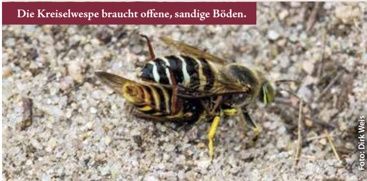
Die Kreiselwespe braucht offene, sandige Böden.

Trocken, karg und heiß im Sommer – Heiden sind nicht nur ein ästhetisch ansprechendes Biotop, sondern haben im Vergleich zu Wäldern und Wiesen auch ein extremes Kleinklima. Gerade diese Bedingungen sagen aber seltenen Vogelarten, wie Heidelerche und Ziegenmelker aber auch hunderten Insektenarten zu. Viele sind nur noch in den Heiden und auf Binnendünen zu finden. Auf den Roten Listen stehen sie sowieso. Neben Kreiselwespen, Ameisenlöwen und Schmetterlingen hat sich sogar die wärmeliebende Gottesanbeterin bis in unsere Region ausgebreitet und wartet nun auch in der Heide auf Beute. Auch für viele Pflanzenarten stellt die Heide ein Refugium dar. Exotisch klingende Arten wie Bauernsenf, Frühlings-Spark, Silbergras und Sprossende Felsennelke kann der kundige Botaniker hier entdecken. Auch der einst weit verbreitete Wacholder wurde in der Göbelner Heide und bei Bärwalde durch die Ranger des Biosphärenreservates wieder angesiedelt.