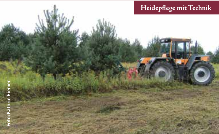
Heidepflege mit Technik

Impressum: Herausgeber: Staatsbetrieb Sachsenforst, Biosphärenreservatsverwaltung Oberlausitzer Heide- und Teichlandschaft, Warthaer Dorfstraße 29, D-02694 Malschwitz OT Wartha Tel.: 035932-3650; Fax: 035932-36550 E-Mail: poststelle.sbs-broht@smul.sachsen.de Internet: www.biosphärenreservat-oberlausitz.de